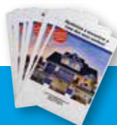
Flyers e folhetos