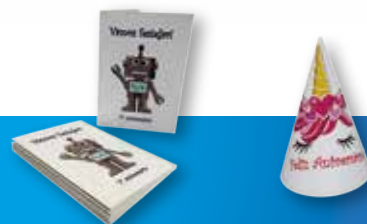
Kits de Aniversário ... e muito mais!