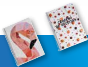
Cadernos de notas

IMPRIMA MATERIAIS PERSONALIZADOS E RENTABILIZE O SEU NEGÓCIO!