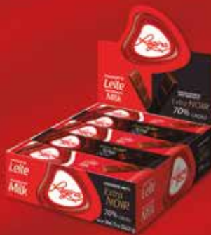
CÓD. 14982 CHOCOLATE LEITE / PRETO CX 30 9,99€*