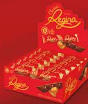
CÓD. 14983 CHOCOLATE C / AMÊNDOAS CX 30 12,80€*