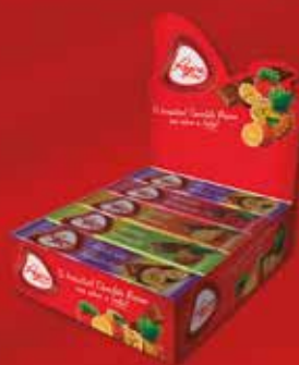
CÓD. 14981 CHOCOLATE LEITE FRUTAS CX 30 9,99€*